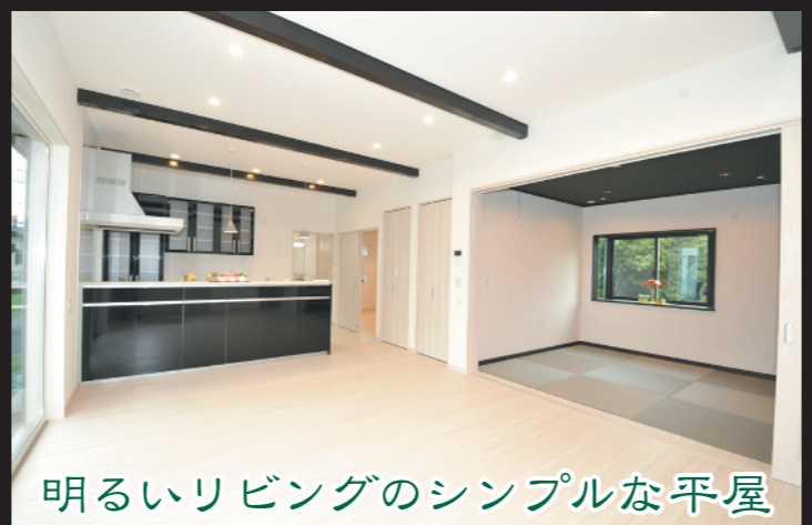
明るいリビングのシンプルな平屋