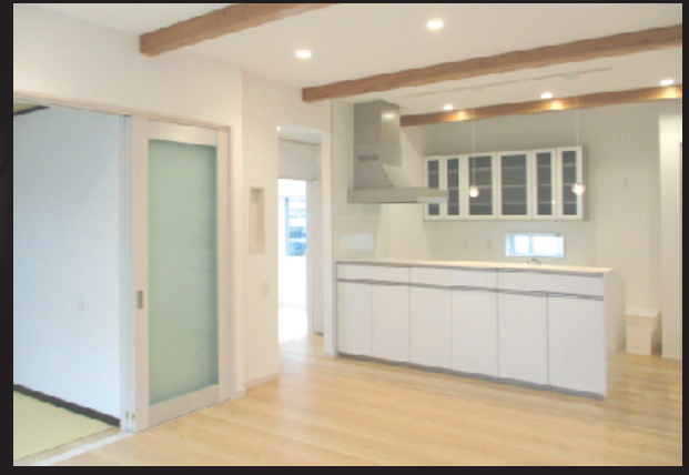
トイレが二つある、収納たっぷりの平屋