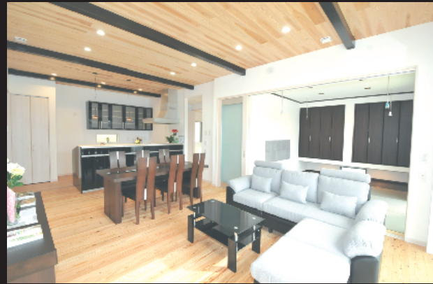
無垢材に囲まれた収納たっぷりの平屋