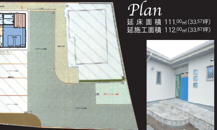
Plan 延床面積 111.00㎡(33.57坪) 延施工面積 112.00㎡(33.87坪)