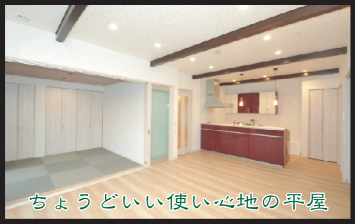
ちょうどいい使い心地の平屋