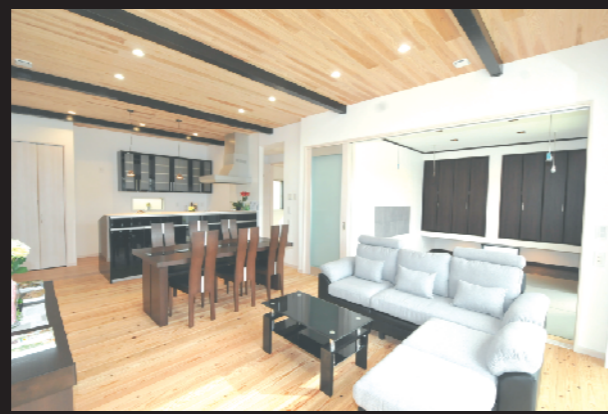
無垢材に囲まれた収納たっぷりの平屋

2020 March 14 (Sat) 15 (Sun) AM10:00~PM5:00