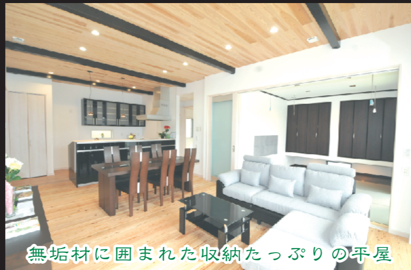
無垢材に囲まれた収納たっぷりの平屋