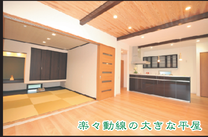
楽々動線の大きな平屋

Plan 延床面積 127.00㎡(38.41坪) 延施工面積 136.00㎡(41.13坪)