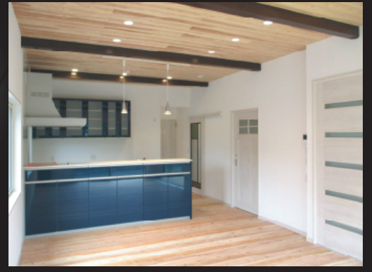
窓に囲まれた明るい平屋