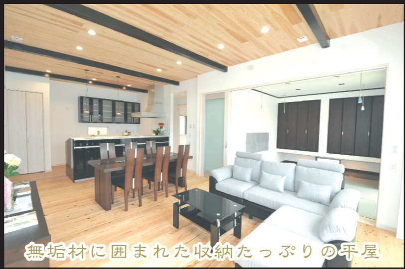
無垢材に囲まれた収納たっぷりの平屋