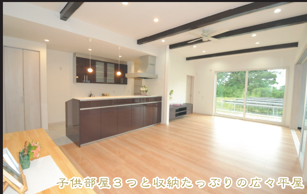
子供部屋3つと収納たっぷりの広々平屋