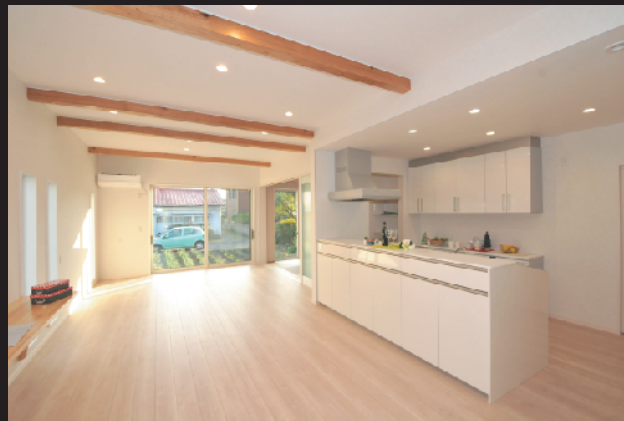
広々リビングの明るい平屋