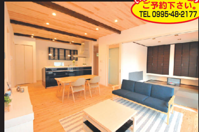
森林浴みたいな健康住宅 (無垢材とマイナスイオン)