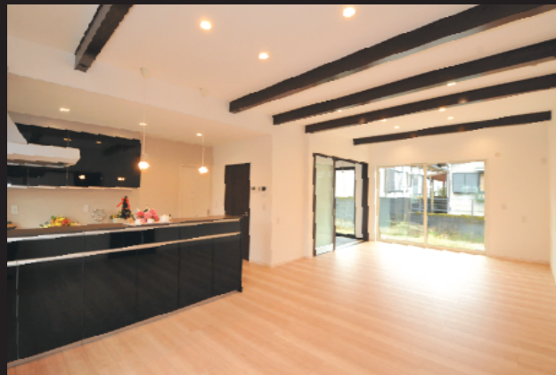
焼酎Barのあるオシャレな平屋