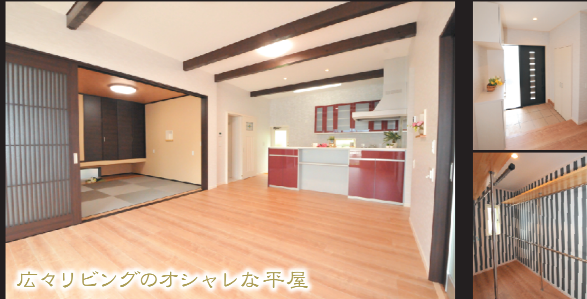
広々リビングのオシャレな平屋