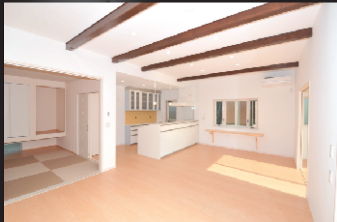
広々リビングの平屋