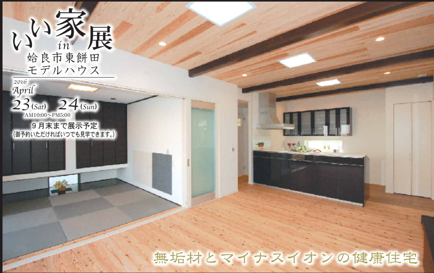
無垢材とマイナスイオンの健康住宅

2016 April 23 (Sat) 24 (Sun) AM10:00~PM5:00 9月末まで展示予定 (御予約いただければいつでも見学できます。)