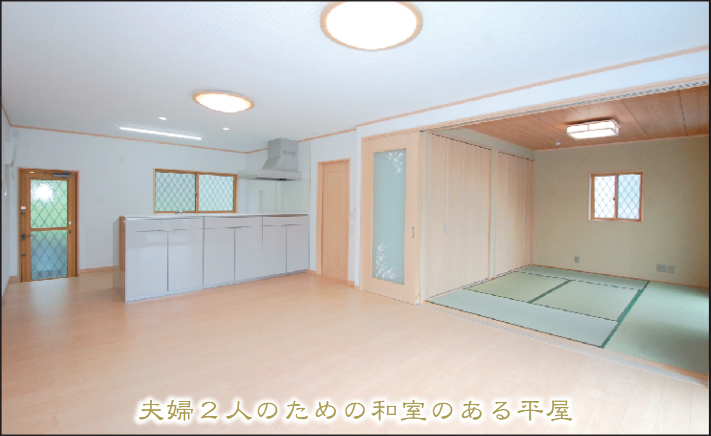
夫婦2人のための和室のある平屋