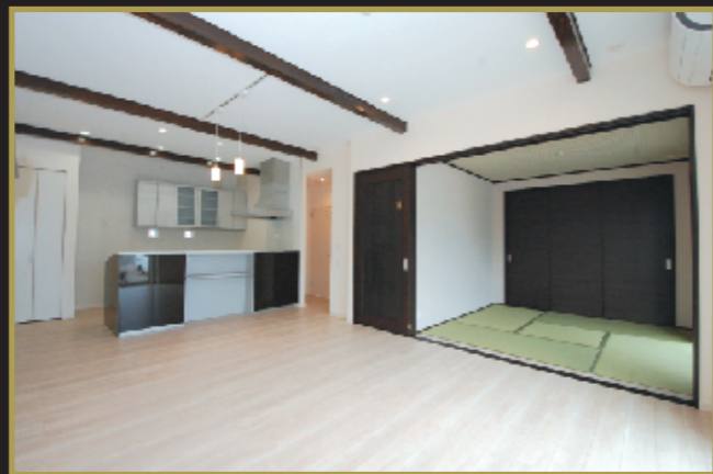
ムダの無い究極の間取りの平屋 (S-cube東西入りプラン)